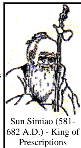
Sun Simiao (581-682 A.D.) - King of Prescriptions

Sun Simiao é um dos médicos mais influentes na história da medicina chinesa, e é distinto por sua aplicação em medicina e sua lealdade a um código de ética. Seu interesse em medicina veio de sua própria saúde fragilizada, que por sinal fez com que tornasse a si mesmo seu primeiro paciente. Sua maestria em medicina, Budismo, Confucionismo e Taoísmo fez com que o imperador Wen da Dinastia Sui e os imperadores Tai-zong e Gao-zu da Dinastia Tang o procurassem como médico imperial. No entanto, Sun Simiao recusou os pedidos e devotou sua vida a servir ao povo. Acreditava que a melhor forma de se cuidar de um paciente era prevenir que a doença não se instalasse. O pior tratamento era aquele que deveria ser ministrado a alguém que já estivesse doente, pois significava que fora incapaz de manter seu paciente saudável.