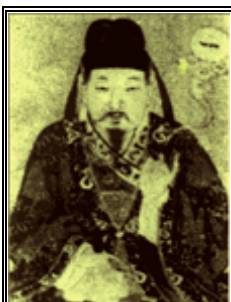
Zhang Congzheng (1150 - 1228 DC)

Três Tipos de Fatores Patogênicos: A classificação de fatores patogênicos em tempos antigos incluía fatores endógenos, exógenos e nem endógenos, nem exógenos. Fatores endógenos basicamente se referem aos sentimentos e influências psicológicas na mente, que incluem alegria, raiva, ansiedade, melancolia, pesar e medo. Fatores exógenos são influências sazonais ou variações climáticas da natureza que incluem vento, frio, calor de verão, umidade, secura e fogo. Nenhum dos dois se refere à qualquer infortúnio como falta de moderação, fadiga, trauma e presença de parasitas no corpo.