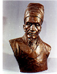
Li Shizhen (1518-1593)

Durante a infância, Li Shizhen trabalhou na loja de ervas da família e acompanhava seu pai nas visitas aos pacientes. Seu pai tinha sonhos de seu filho tornando-se um funcionário público, mas Li falhou diversas vezes nos exames e foi obrigado a permanecer nos negócios da família. Em 1552, começou a trabalhar na sua matéria médica, um compêndio que ele desejava ser livre dos erros das publicações passadas. Durante esses anos, foi admitido na Academia de Medicina de Peking, uma instituição de prestígio para médicos promissores e famosos. Desapontado com a experiência, retornou à sua cidade natal e viajou por toda a China, visitando províncias como Henan, Anhui, Jiangxi e Hubei para colher informações para seu livro. O Bencao Gangmu (Compêndio da Materia Medica) não foi publicado até 1596, três anos após a morte de Li.