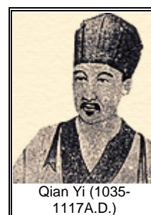
Qian Yi (1035-1117 A.D.)

Qian Yi era órfão, fora criado por seu tio e aprendeu medicina. Dedicou 40 anos de sua vida ao tratamento de crianças.