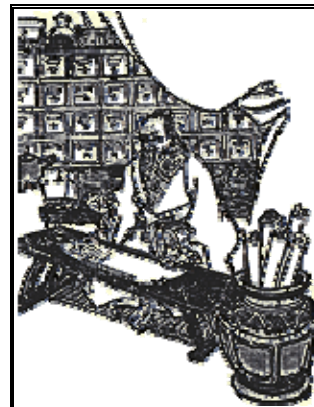
Zhang Zhongjing, the 'Sage of Medicine'

Durante seu tempo, enfermidades epidêmicas e infecciosas prevaleciam, e resultaram em um grande número de mortes. O interesse de Zhang Zhongjing em enfermidades febris, surge do fato de que dois terços de sua família (200 pessoas) morreram, e a maior parte dessas mortes se deram devido à febres. Fora essa situação que fez com que Zhang escrevesse o Shanghan Zabinglun ( Discurso sobre Febres e Enfermidades Mistras ).