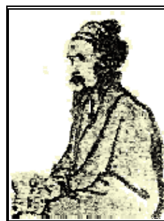
Huangfu Mi – quem escreveu o Zhongyuxue Jichu

Huangfu Mi que não fora, inicialmente, um médico. Decidiu estudar medicina chinesa quando desenvolveu um reumatismo com a idade de 40 anos, e terminou devotando o resto de sua vida à prática.