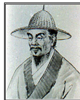
Ge Hong, Alchemist and Physician

Ge Hong , também conhecido pelo pseudônimo de Baopuzi, contribuiu significativamente para o futuro da medicina farmacêutica. Era o sobrinho-neto de Ge Xuan, Taoísta e Alquimista do período dos Três Reinos. No entanto, era o discípulo de seu tio-avô, Zheng Yin, que apresentou Ge Hong à alquimia. Teria feito diversos experimentos e trabalhado com substâncias como o cinabre (substância alquímica mais popular da época), rosalgar, enxofre, alume, mica, ferro e estanho. Em acréscimo a essas substâncias, também se interessava pelos valores medicinais de plantas e fungos.