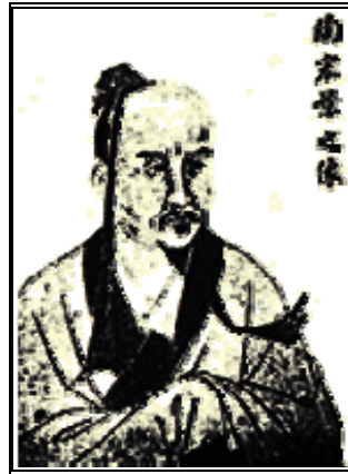
Tao hongjing, Commentator of the Shennong Bencaojing

Tao Hongjing fora um Taoísta que vivera durante as três primeiras Dinastias do Sul. Possuía diversos interesses fora a medicina, incluindo astronomia, música, xadrez, caligrafia e geografia. Suas contribuições mais notáveis foram seus acréscimos ao Shennong Bencaojing ( Classico da Medicina Herbal ) escrito durante a Dinastia Han.